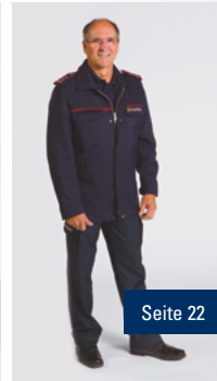
B1 Dienstkleidung, Grundform