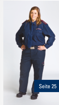
B2 Gehobene Dienstkleidung