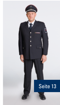
A2 Leichter Dienstanzug