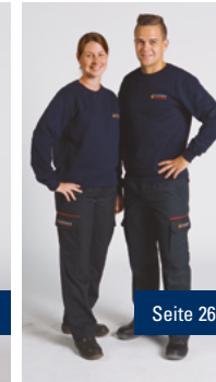
B4 Legere Dienstkleidung