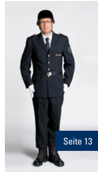
A4 Großer Dienstanzug