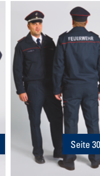
C1 Cargo-Kombination mit Jacke